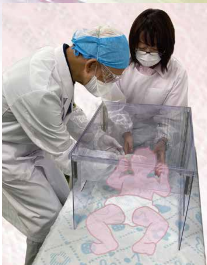
検査実施イメージ